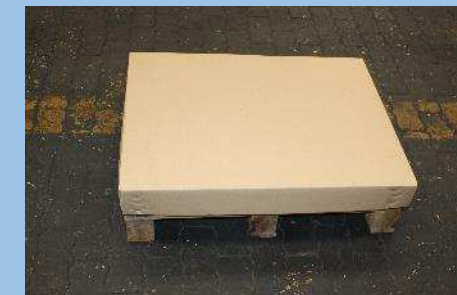
zusammengelegter Flexitainer bereit zur Auslieferung