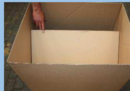
Einlage des Zuschnittes in die aufgebaute Faltkiste