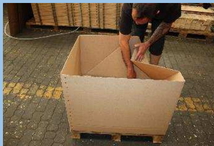
Zusammenlegen der Faltkiste