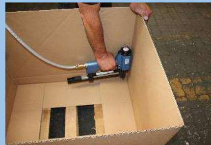
Fixierung der Faltkiste mit Hilfe von Klammern