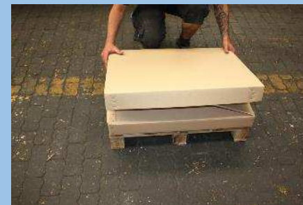
Auflage des Stülpedeckels auf zusammengelegte Faltkiste