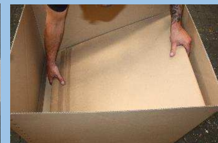
Einlage des Innenrings in die aufgebaute Faltkiste