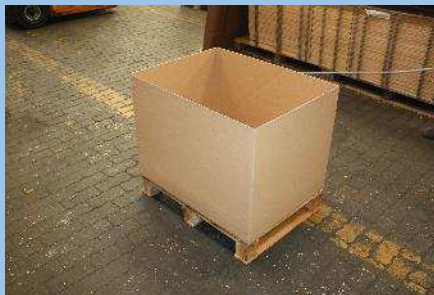
Platzierung der Faltkiste auf die Palette