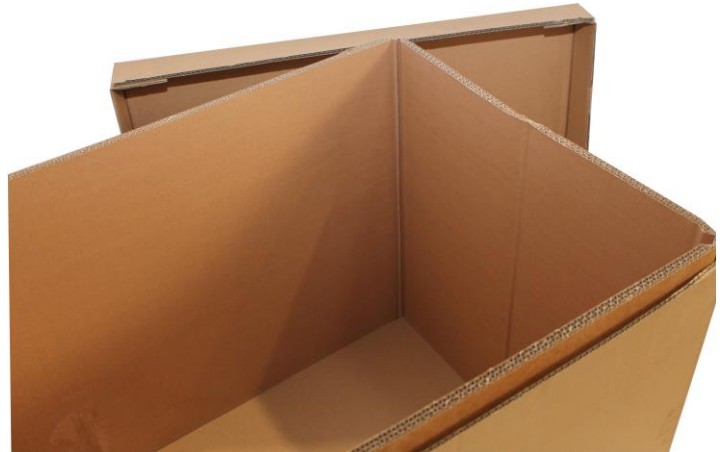
Flexitainer innen + Innenhülle 3-wellig + Stülpdeckel